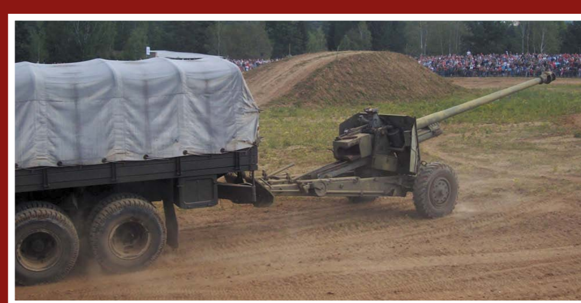
Tatra T-111 s protitankovým kanónem vz. 53