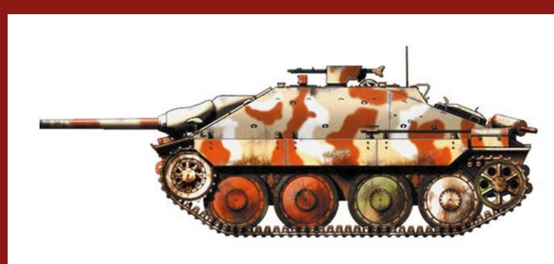
Jagdpanzer 38(t) „Star“