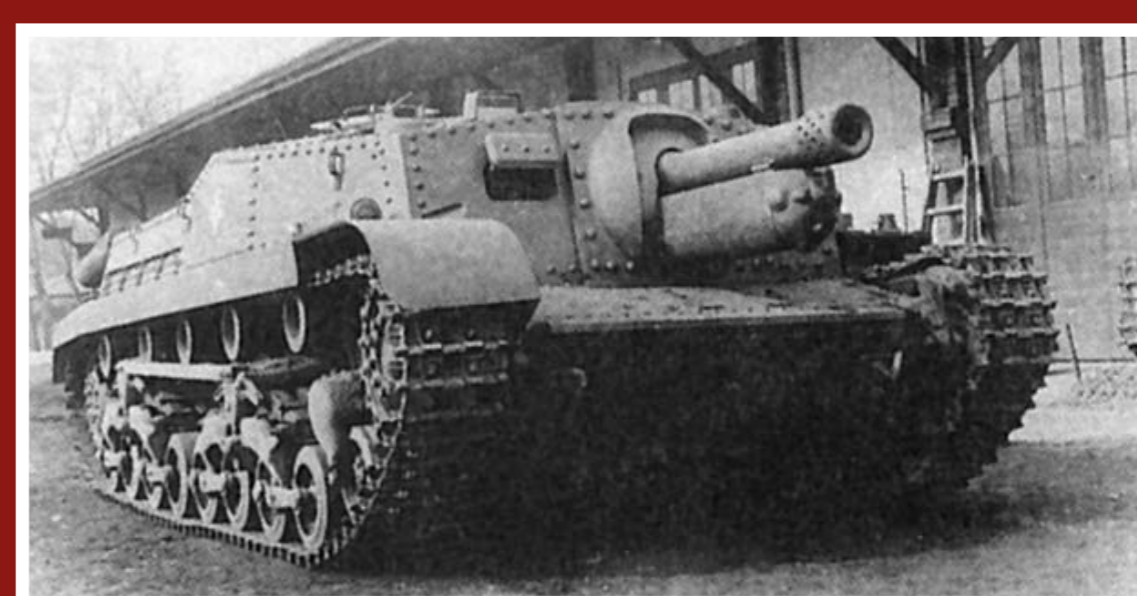
Útočné dělo Zrinyi II