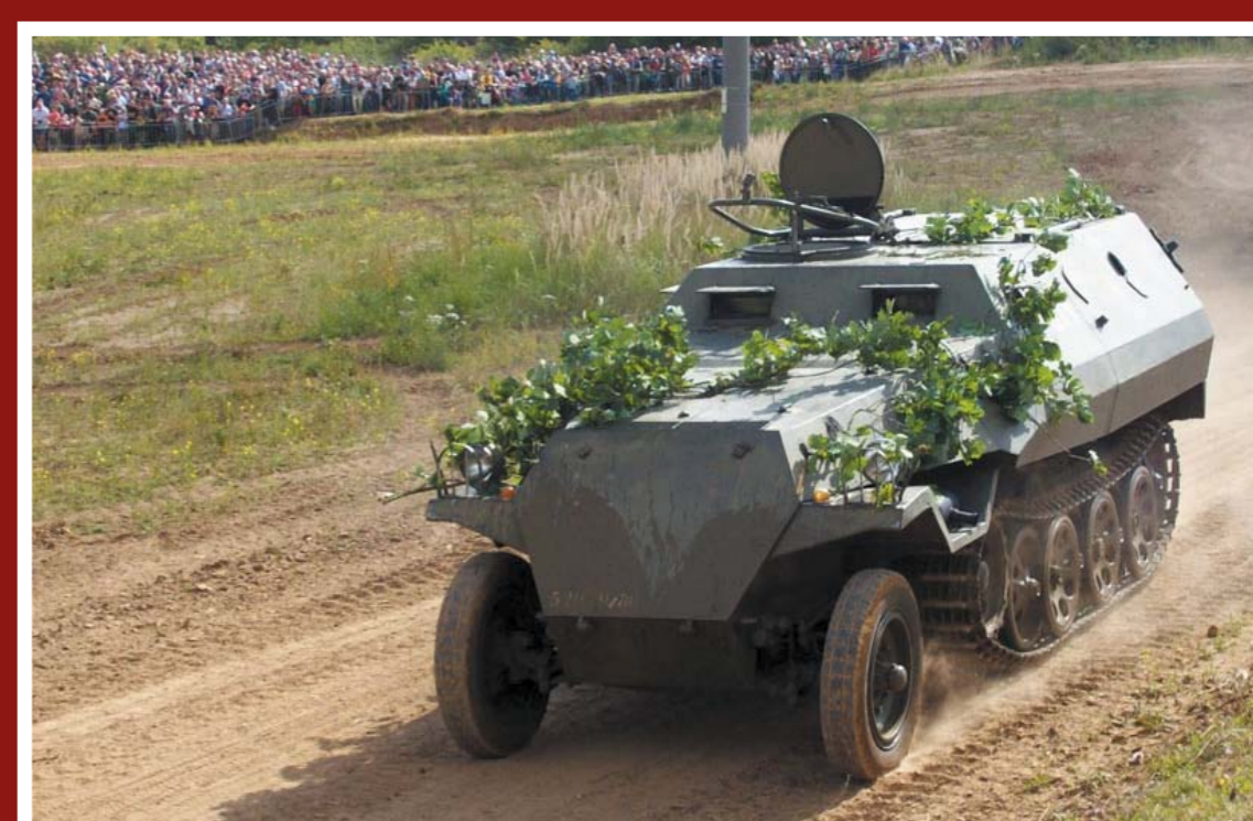
OT-810 HAKO (Sd.Kfz. 251)