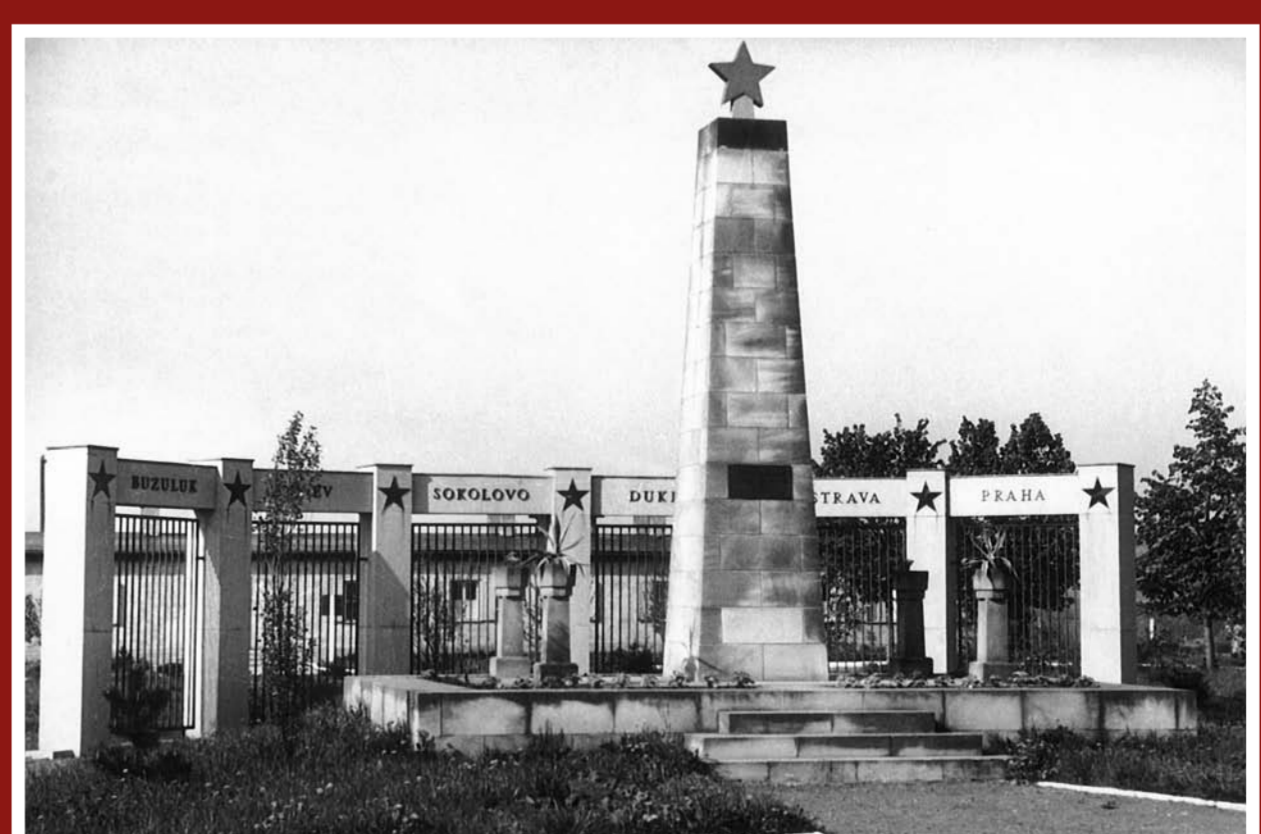
Památník „Bojová cesta“ před velitelskou budovou VVU OJ