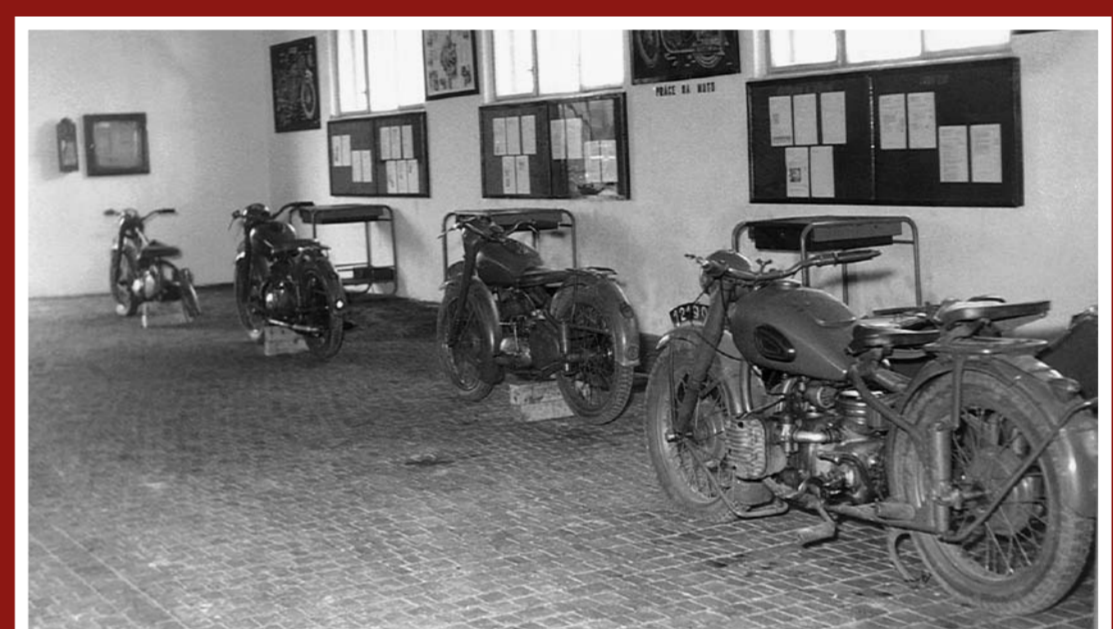
Učebna A-9 s motocykly J-250 a M-72 pro praktickou přípravu