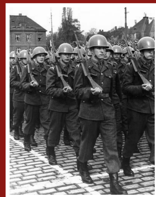
Přehlídka VVU OJ ve Vyškově