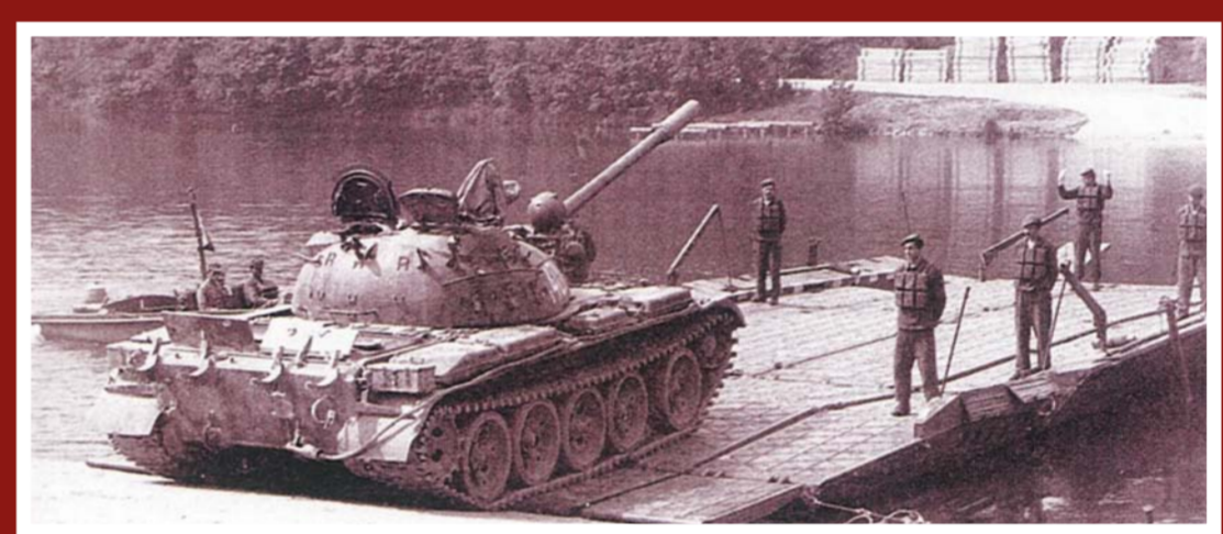
Posluchači VVU OJ na Myslejovické přehradě