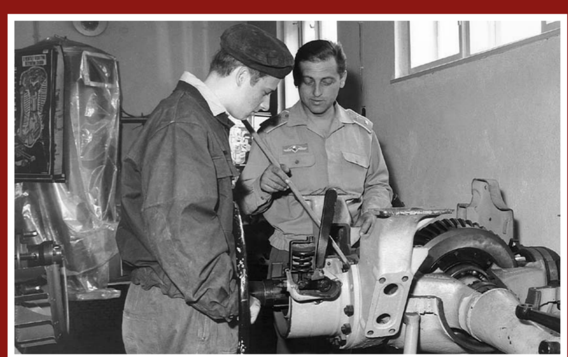
Laboratoř vozidel A-19